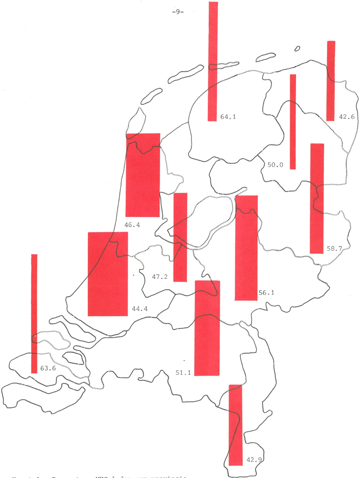
Kaart 1.: Percentage NHG-leden per provincie, voorjaar 1979.