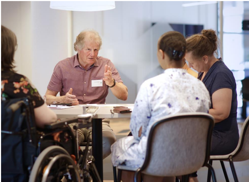
Foto 7.1 De deelnemers discussiëren in groepjes over het breed maatschappelijk centrum in de wijk

“Dan zou ik niet willen dat al mijn gegevens bij al die instanties liggen. Als ik bijvoorbeeld schulden heb, wil ik helemaal niet dat mijn huisarts dat weet of andersom” (deelnemer 16, vrouw, 40-64 jaar).