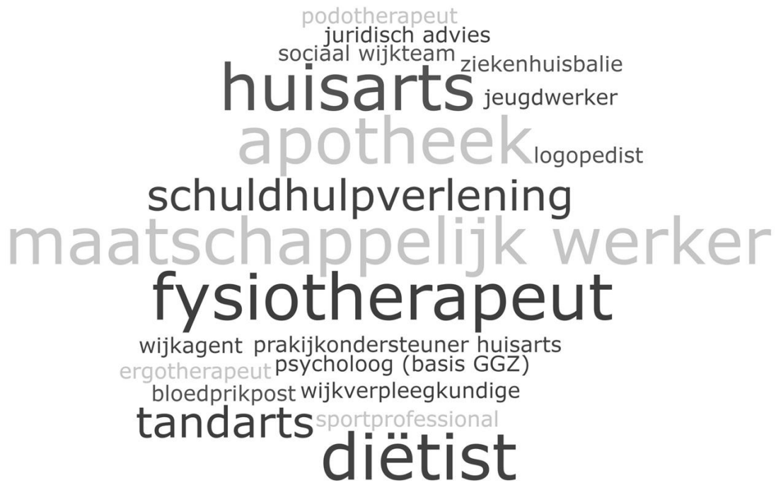
Figuur 7.1 Woordwolk met de genoemde zorgprofessionals en organisaties*

* Woorden die groter zijn in de woordwolk, zijn vaker genoemd door de deelnemers