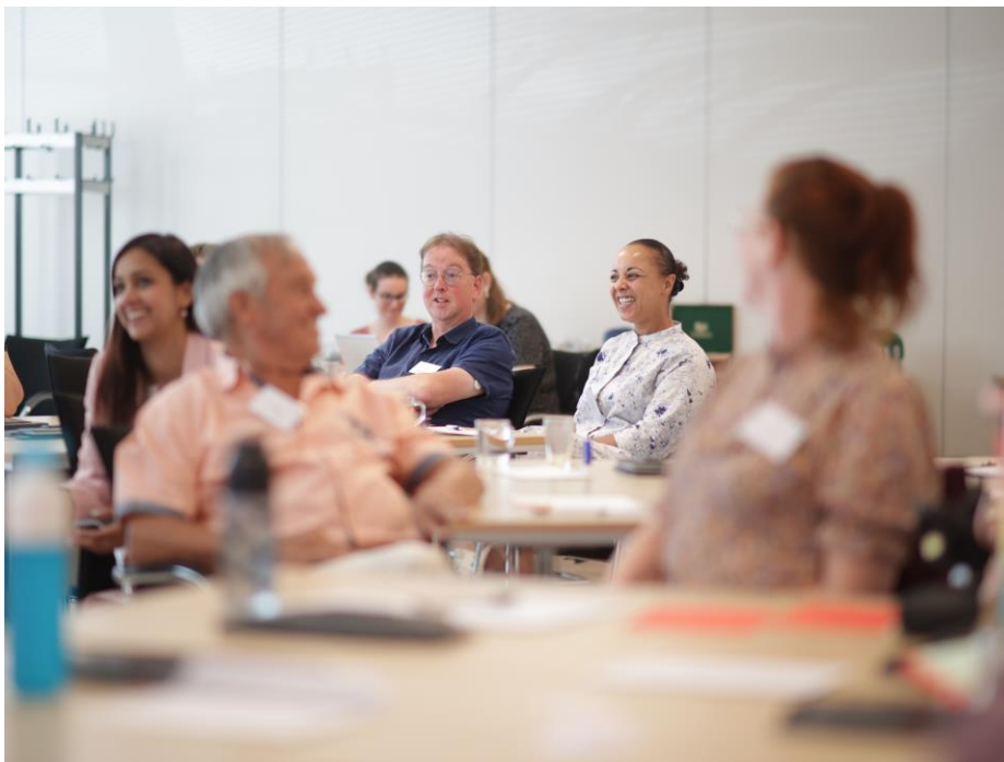
Foto 6.1 De groepjes koppelen hun bevindingen terug aan de groep

Daarbij gaven de deelnemers aan dat de mate waarin zij open staan voor hybride zorg altijd afhankelijk is van hun symptomen of zorgvraag. De deelnemers gaven aan dat het bij meer complexe zorgvragen prettig kan zijn om een zorgprofessional fysiek te bezoeken, omdat deze dan ook andere problemen kan signaleren dan de klacht waarvoor de patiënt de zorgprofessional bezoekt. Een deelnemer met een chronische aandoening noemde dat zij een keer naar de huisarts ging en dat de huisarts toen opmerkte dat ze er bleek uit zag. Dit is volgens de deelnemer lastiger te signaleren bij een digitaal consult. Daarnaast is bij sommige vragen lichamelijk onderzoek nodig.