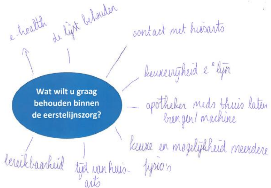
Figuur B.1 Voorbeeld mindmap 'Wat wilt u graag behouden binnen de eerstelijnszorg?'