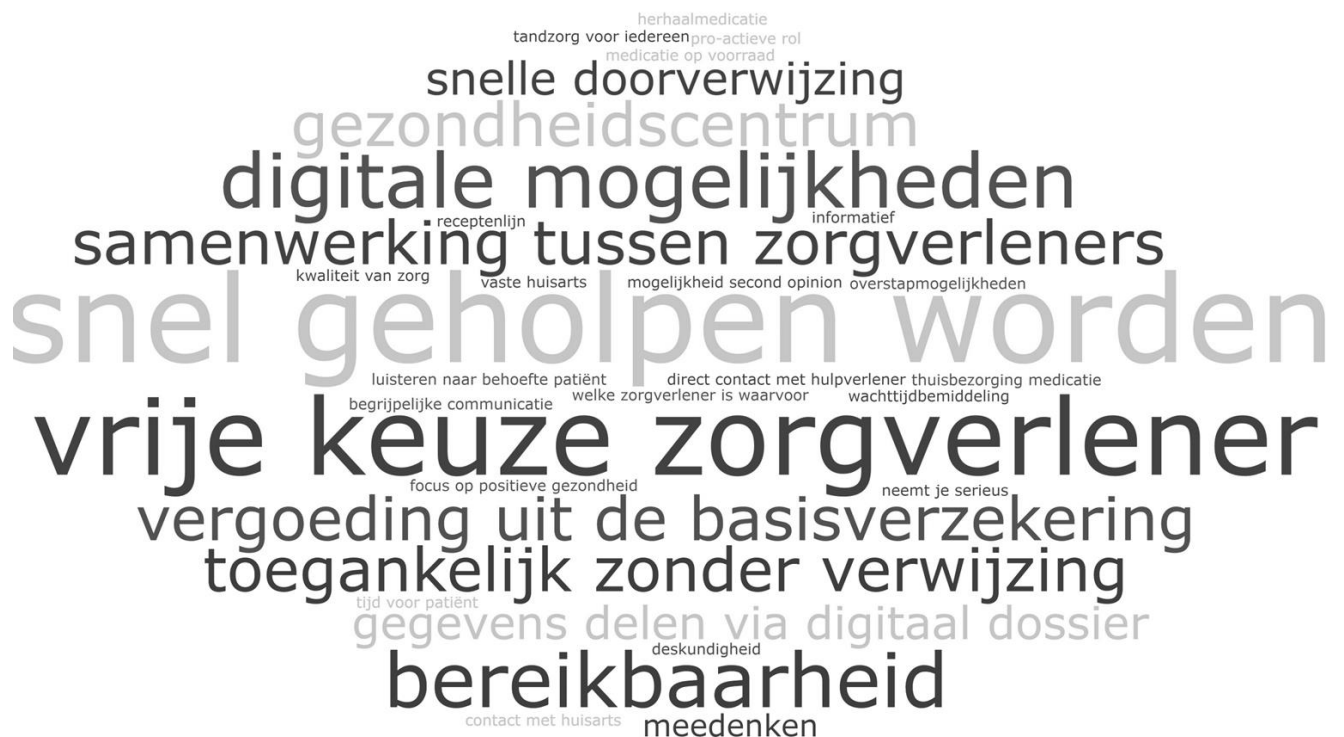
Figuur 4.1 Woordwolk met wat de deelnemers willen behouden aan de eerstelijnszorg*

* Woorden die groter zijn in de woordwolk, zijn vaker genoemd door de deelnemers