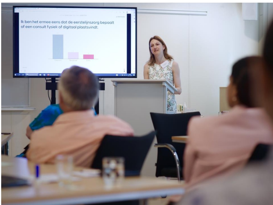
Foto 6.2 Het bespreken van de stellingen

Discussie was erover of de eerstelijnszorg mag bepalen of een consult fysiek of digitaal plaatsvindt (stelling 4). Volgens de deelnemers was het bij deze stelling niet duidelijk of, en zo ja met wie, er een eerste contact over een gezondheidsvraag zou zijn. Dit bleek een belangrijke factor te zijn voor de deelnemers. Als er een eerste digitaal of telefonisch contact zou zijn met een zorgverlener die daarbij een inschatting zou maken of een fysieke afspraak al dan niet nodig was, waren meer deelnemers het eens met de stelling. Daarbij sprak één deelnemer een sterke voorkeur uit voor een arts ten opzichte van een assistent, omdat een arts volgens deze deelnemer over meer kennis beschikt. Een andere deelnemer stond er wel voor open om hierover contact te hebben met een assistent: