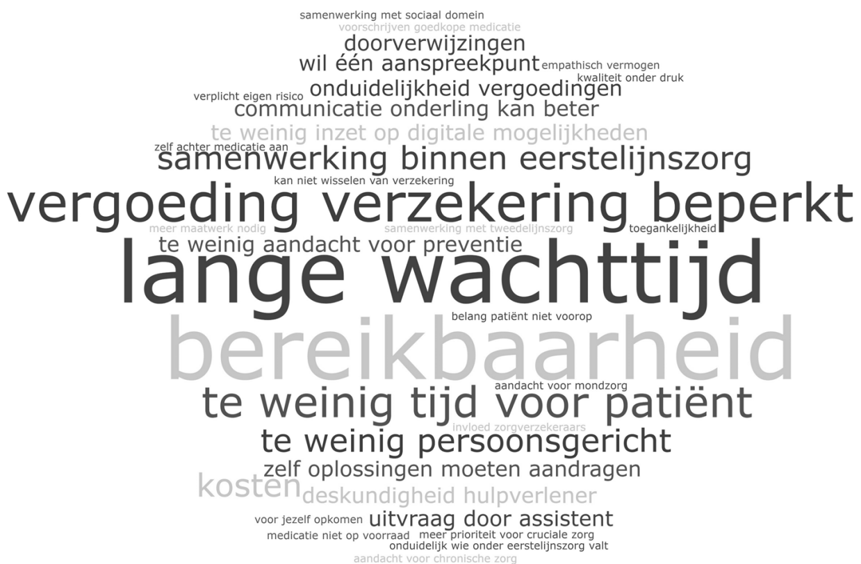
Figuur 4.2 Wordwolk met de knelpunten die de deelnemers ervaren in de eerstelijnszorg*

* Woorden die groter zijn in de woordwolk, zijn vaker genoemd door de deelnemers