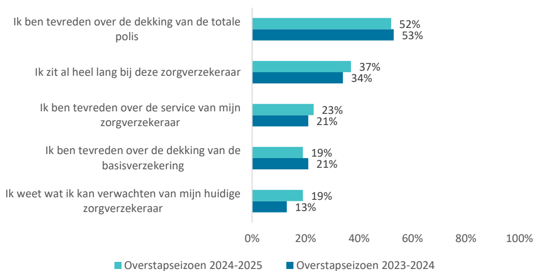
Figuur 3 Top 5 meest genoemde redenen om bij de huidige zorgverzekeraar te blijven (n=729) (Respondenten konden meerdere redenen aankruisen)

Figuur 3 toont de top 5 meest genoemde redenen om bij de huidige zorgverzekeraar te blijven in overstapseizoen 2024-2025. Er zijn weinig verschillen te zien in de huidige top 5 ten opzichte van voorgaande jaren E . Meer dan de helft (52%) van de niet-overstappers geeft aan bij de huidige zorgverzekeraar te blijven, omdat ze tevreden zijn over de dekking van de totale polis E . Dit is, net als in vorige jaren, de meest genoemde reden om niet over te stappen van zorgverzekeraar 1-8 . 'Ik zit al heel lang bij deze zorgverzekeraar' staat net als in het vorige overstapseizoen op nummer twee van genoemde redenen om bij de huidige zorgverzekeraar te blijven. In tegenstelling tot het overstapseizoen 2023-2024 staat de reden 'Teveel moeite om te zoeken naar een andere zorgverzekering' dit overstapseizoen niet in de top 5 meest genoemde redenen om bij de huidige zorgverzekeraar te blijven. In 2024 gaf 18% van de niet-wisselaars dit aan ten opzichte van 16% in 2025.