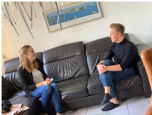
Interview bij één van de jongeren thuis

In eerste instantie werden de interviews gestructureerd aan de hand van de foto's: de jongeren bepaalden waar het over ging. Hierbij gebruikten we vragen uit de PHOTO-methode om de jongeren te laten vertellen over de foto's (Hergenrather et al., 2009). Deze vragen waren: "Beschrijf jouw foto" ( P icture), "Wat gebeurt er op jouw foto?" ( H appening), "Waarom heb je hier een foto van gemaakt" ( O f this), "Wat vertelt deze foto over jouw deelname aan de Class?" ( T ell) en "In hoeverre droeg dat bij aan of belemmerde dat jouw leven, situatie of deelname aan de Class"? ( O pportunities). Daarnaast gebruikten we een topiclijst om na het interview te checken of er nog andere belangrijke onderwerpen waren die aan bod konden komen (zie bijlage C). Wanneer jongeren geen foto's hadden gemaakt, was de topiclijst leidend in het interview.