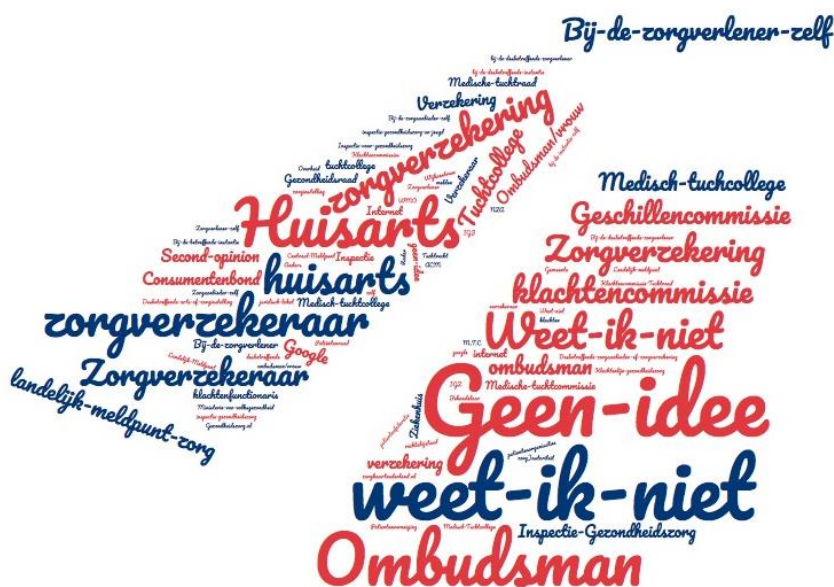
Figuur 3 Waar zou u terecht kunnen met een klacht over de gezondheidszorg?

Alle respondenten werden allereerst open bevraagd naar hun ideeën over bij wie zij terecht zouden kunnen met een klacht over de gezondheidszorg. Deze antwoorden staan weergegeven in figuur 3. Vervolgens werd deze vraag nogmaals gesteld, maar dan met verschillende antwoordcategorieën (tabel 28). Hoewel het antwoord ‘bij de zorgverlener zelf’ in beide gevallen veelvuldig voorkomt, is het bij de open bevraging (figuur 1) opvallend dat een groot deel van de respondenten aangeeft het niet te weten (antwoordcategorieën “geen idee” en “weet ik niet”).