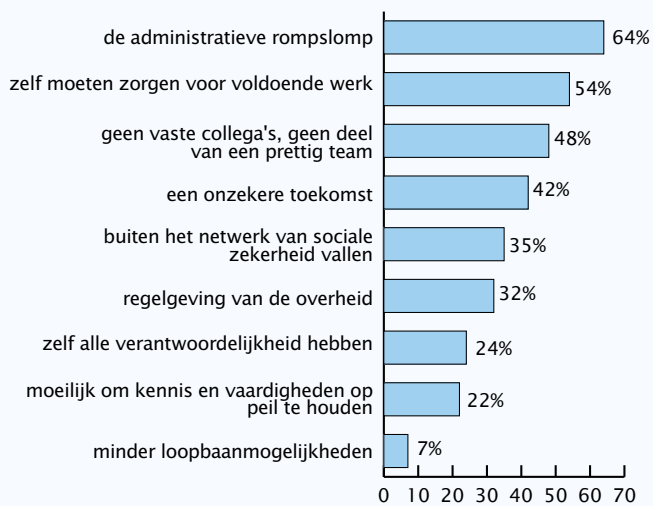
Figuur 2. Percentages verpleegkundigen en verzorgenden die de genoemde aspecten als een nadeel van het werken als zelfstandige ervaren

vrede met de huidige baan de reden is dat een overstap overwogen wordt. Het woord bureaucratie (of verwijzingen daarnaar, zoals 'kortere lijnen') valt regelmatig, evenals verwijzingen naar marktwerking en de productiedruk. 'De bureaucratie die opgelegd wordt door verzekeraars en overheid zorgt ervoor dat je weinig tijd hebt voor de mens', aldus een verzorgende uit een verpleeghuis.